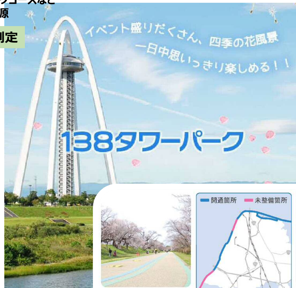
河川敷のサイクリングロード