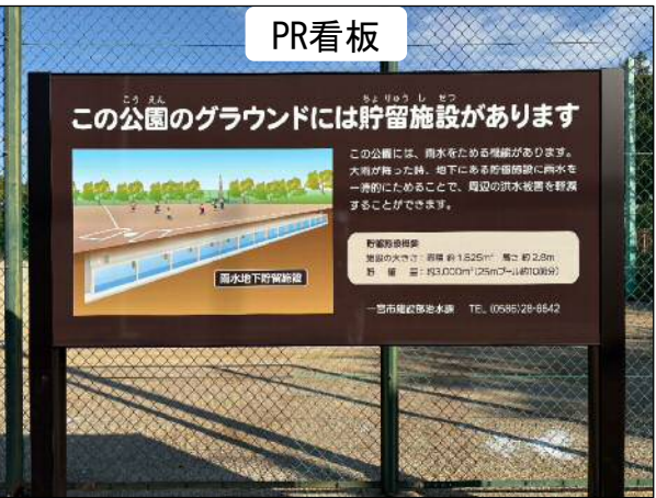
【多加木公園流域貯留施設の完成予定概要】