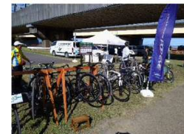
サイクルスタンド