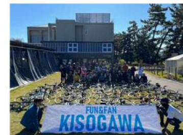
サイクルイベント